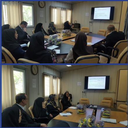
انجمن علمی - دانشجویی آموزش بهداشت و ارتقای سلامت برگزار کرد: