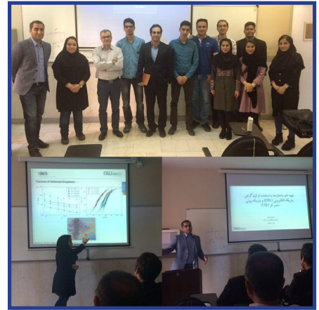
انجمن علمی - دانشجویی مهندسی مواد برگزار کرد:

همراهان عزیز خبرنگارمه «گذر فرهنگ» می توانند نظرات و پیشنهادهای خود را به رایانامه زیر ارسال کنند: foad@modares.ac.ir