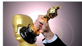
نگاهی از آسمان