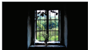
کدام فقر؟ کدام ایمان؟

نه، اشتباه نکنیم؛ ایمان با اقتصاد شکوفا در تضاد نیست، همانگونه که فقر در دنیا لزوماً منجر به سعادت اخروی نمی‌شود، و البته فقر اقتصادی هم لزوماً به کفر منجر نمی‌شود. حدیث نورانی «کاد الفقر ان یكون کفرا» مستعد بد فهمی است.