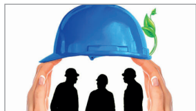
همراه با تحصیل کار کنید!